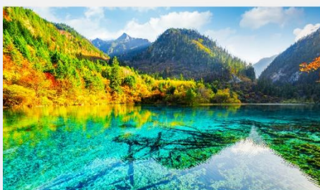
อุทยานแห่งชาติจื่อจ้ายโกว